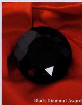
Black Diamond Award

Paris-HotSpa souhaite honorer chaque année une femme ou un homme de l'univers de l'hôtellerie et du spa qui aura obtenu la reconnaissance de ses pairs et aura été choisi par un collège de professionnels et de journalistes spécialisés de l'hôtellerie et du Spa.